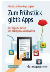
Gerald Lembke / Ingo Leipner Zum Frühstück gibt's Apps. Springer Spektrum, Heidelberg (2014)

Gewinnen Sie Ihre Orientierung im digitalen Dschungel zurück! Dieses Buch liefert praktische Tipps, wie Sie die neuen Medien bewusster einsetzen, um Ziele und Ideen in der realen Welt zu verwirklichen. Geschichten aus dem Alltag illustrieren, wo Fallen im Netz lauern – und wie Sie ihnen ausweichen. So schaffen Sie mehr Freiraum für „echte“ Kommunikation.