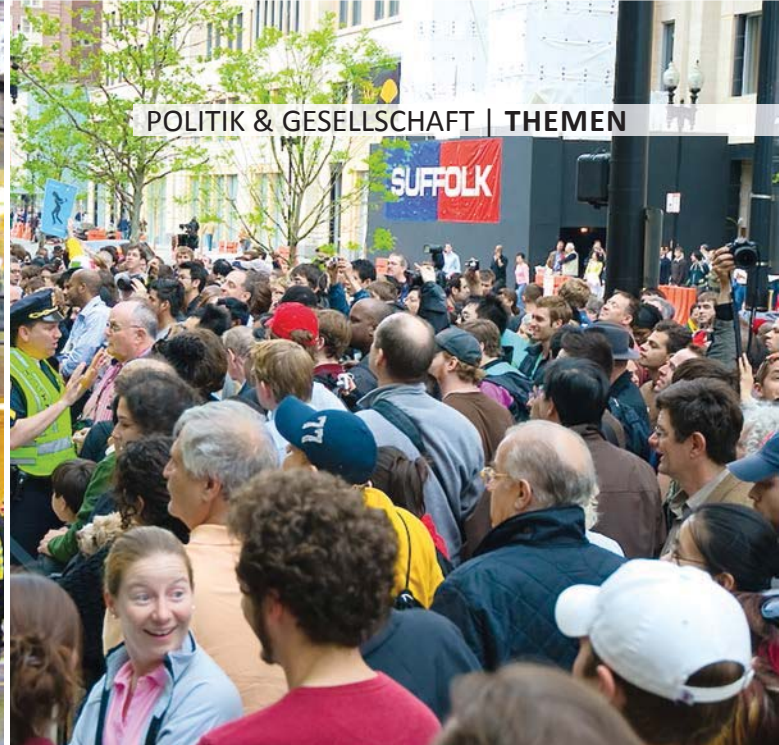
Die modernen Kathedralen des Konsums. Apple Stores mit Polizeischutz bei Ankunft der neuesten Handygeneration.